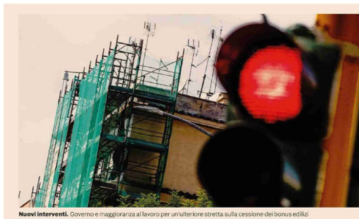
Nuovi interventi. Governo e maggioranza al lavoro per un'ulteriore stretta sulla cessione dei bonus edilizi

Sul tavolo l'ipotesi di consentire solo la detrazione con tempi più lunghi di recupero