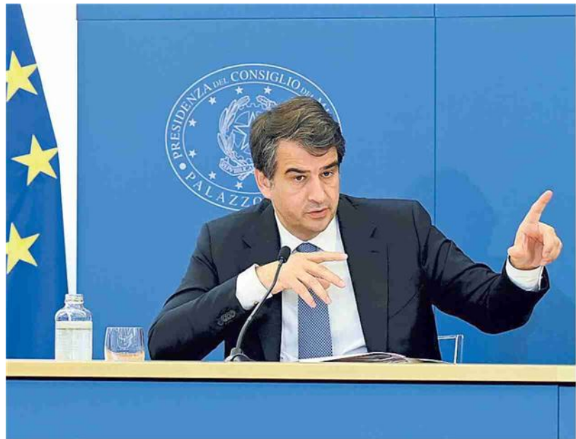
▲ Il ministro per gli Affari europei Raffaele Fitto. Cura anche il Pnrr