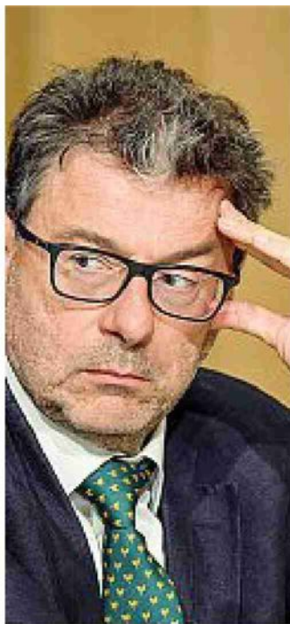
Il ministro Giancarlo Giorgetti