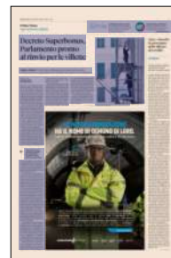
Peso: 1-4%, 7-34%

Terzo capitolo di intervento riguarda l'edilizia libera: caldaie e infissi. Il problema, in questo caso, riguarda tutti quei lavori con acconti pagati prima del 16 febbraio, ma con prodotti ancora da installare. Tra le proposte di modifi-