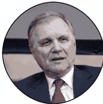
Ignazio Visco Governatore Bankitalia

Parte oggi il collocamento della diciannovesima emissione del Btp Italia che avrà una cedola (reale) annua minima fissata al 2,00%