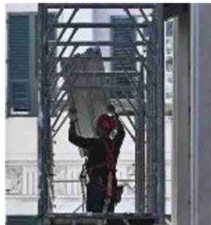
Lavori di edilizia