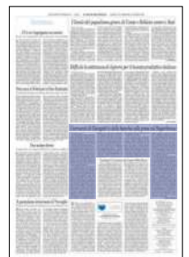
Peso: 1-4%, 3-15%