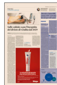
Peso: 1-2%, 6-25%

parto residenziale - dice il paper Ance - l'obiettivo della direttiva comporta il miglioramento della prestazione energetica di oltre 1,8 milioni di edifici in dieci anni, ovvero circa 180 mila interventi ogni anno. Se consideriamo anche i fabbricati con destinazione non residenziale con obbligo di riqualificazione, il numero degli interventi, ogni anno, sarà pari almeno a 215 mila. Si tratta di un numero in linea con quanto realizzato in media