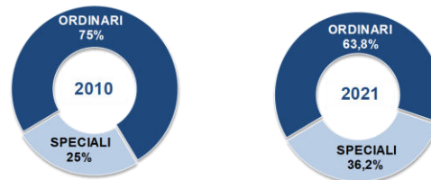
APPALTI PUBBLICI PER LAVORI Composiz.% del valore a base di gara (bandi e inviti di importo ≥40mila€) per tipologia di settore