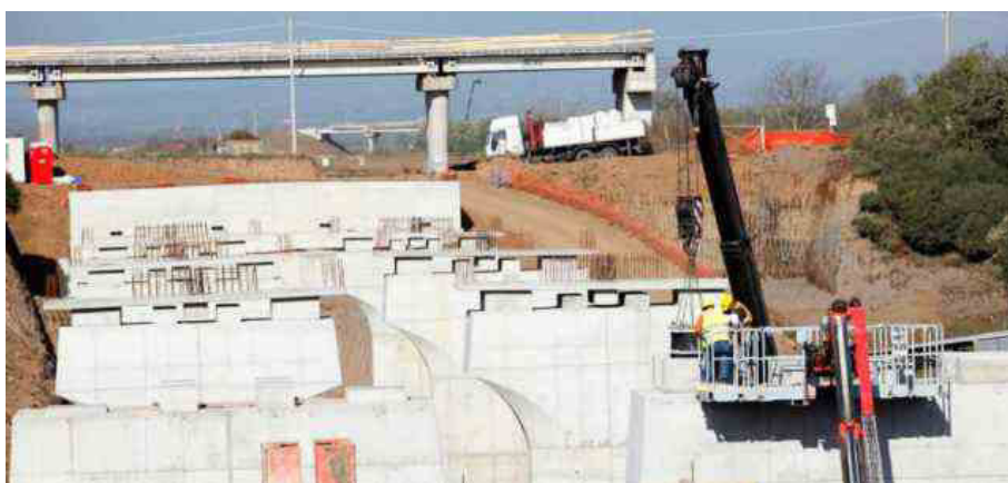
Cantiere stradale Anas

Il settore delle costruzioni rischia il blocco dei cantieri a causa dei rincari di energia e materiali. "Il primo obiettivo è salvaguardare le opere già in esecuzione"