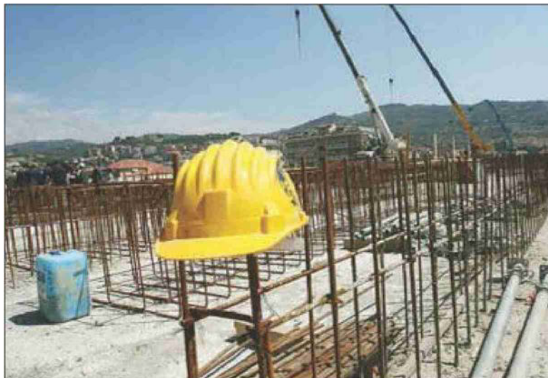
L'80% dei progetti non ha un programma esecutivo che consente di aprire il cantiere