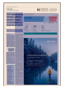
Peso: 1-3%, 7-49%

Il secondo dato che confermerebbe il fenomeno della scarsa strutturazione delle nuove imprese è che il 35% delle imprese neonate vede la partecipazione di soggetti con codice fiscale straniero.