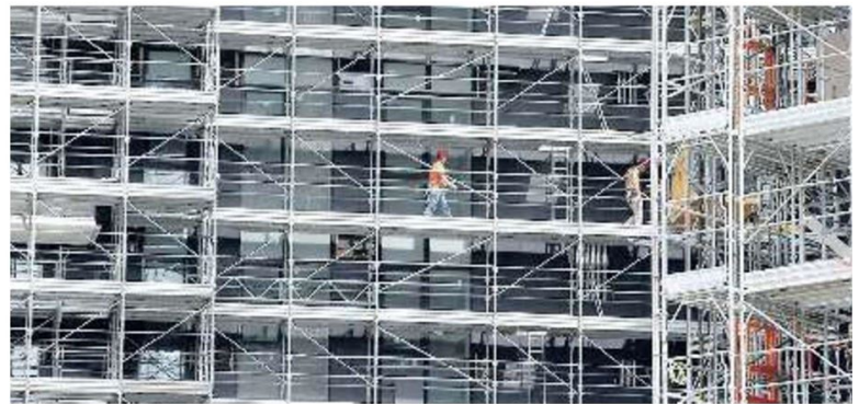
Operai al lavoro in un cantiere per l'efficiamento energetico di un condominio

LA SPINTA DEL GOVERNO DURANTE LA PANDEMIA A IMMETTERE LIQUIDITÀ