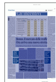
Peso: 1-5%, 17-85%

U na nuova stretta. Questa volta draconiana. Sui superbonus edilizi il governo prova a chiudere i cancelli alle frodi. Ma il rischio è che molti buoi sia-