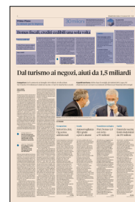
Peso: 1-2%, 4-19%

Per i bonus già ceduti al 7 febbraio 2022 ammesso solo un altro passaggio o il contratto sarà dichiarato nullo