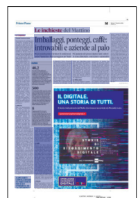
Peso: 1-6%, 11-47%

maggio a pasta fresca: comincia a mancare pure quella. E così per i tondini in cemento, i pallet in legno, i semilavorati del rame, il caffè