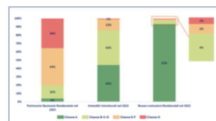
Distribuzione degli immobili per classe energetica (2023)

Secondo i dati del SIAPE, elaborati dal Crif, attualmente solo il 4% degli immobili residenziali italiani è in classe energetica A. Tuttavia, è bene sottolineare che oltre il 40% degli immobili ristrutturati nel 2023 sono stati portati alla classe A, percentuale che aumenta al 90% nel caso delle nuove costruzioni. "Un processo di efficientamento che è dunque già in corso", sottolinea il Crif.