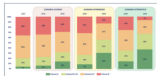
Distribuzione degli immobili residenziali per classe energetica nei tre scenari di analisi CRIF

Lo scenario più ottimistico secondo Crif è, invece, il più fattibile e con le maggiori garanzie. In questo contesto si riscontrano miglioramenti più netti, con una riduzione degli immobili in classe G al 26% entro il 2030 e al 7% entro il 2050, e un aumento significativo degli immobili in classe A che toccano il 14% nel 2030 e il 37% nel 2050 sul totale degli immobili nazionali.